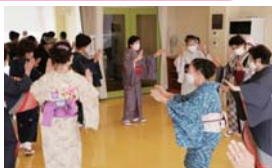
協力：町田市舞踊連合会